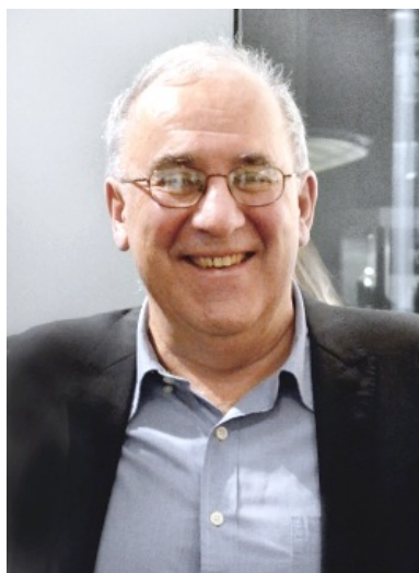
Tod Papageorge, Januar 2014

In seinen Aufnahmen konzentriert sich Papageorge stets auf den Menschen als soziales Wesen, der sich in der Gruppe findet und in dieser Gruppe intensiven Erlebnissen und Erfahrungen ausgesetzt ist. Er verzichtet dabei in der Regel auf Portraits einzelner Personen, denn im Fokus steht nicht das Individuum, sondern die Gemeinschaft. Die Fotografien, entstanden aus Streifzügen durch New York, dokumentieren das Leben der US-Amerikaner und schufen dadurch ein fotografisches Werk mit hoher Authentizität. Seine Arbeiten sind u.a. Bestandteil der Sammlungen der Museum of Modern Art (MoMA) New York und San Francisco.