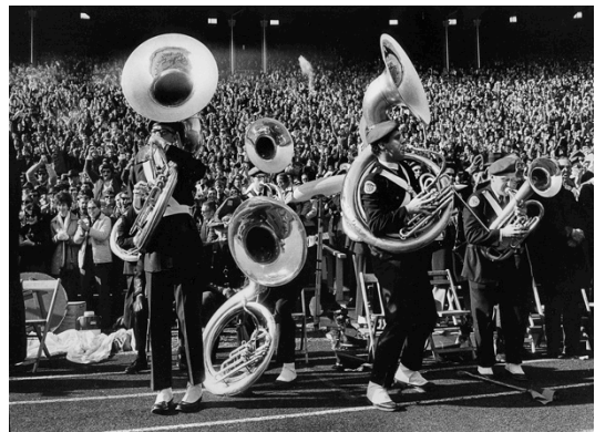
Cotton Bowl Aus der Serie American Sports, 1970 Silbergelatineabzug 27.9 x 35.6 cm

Papageorge reiste für die Serie American Sports, 1970 während des Vietnamkrieges durch Amerika und fotografierte Spiele diverser Nationalsportarten. Er äußerte damit auf seine Weise gesellschaftliche Kritik: die Leichtigkeit des Sports in der Heimat übertüncht den bitteren Krieg in der Ferne. Mit Passing Through Eden hat Papageorge die Poesie des Central Park in New York ins Bild geholt. Inspiriert von der biblischen Genesis, stehen die Fotografien für den Garten Eden des 20. Jahrhunderts.